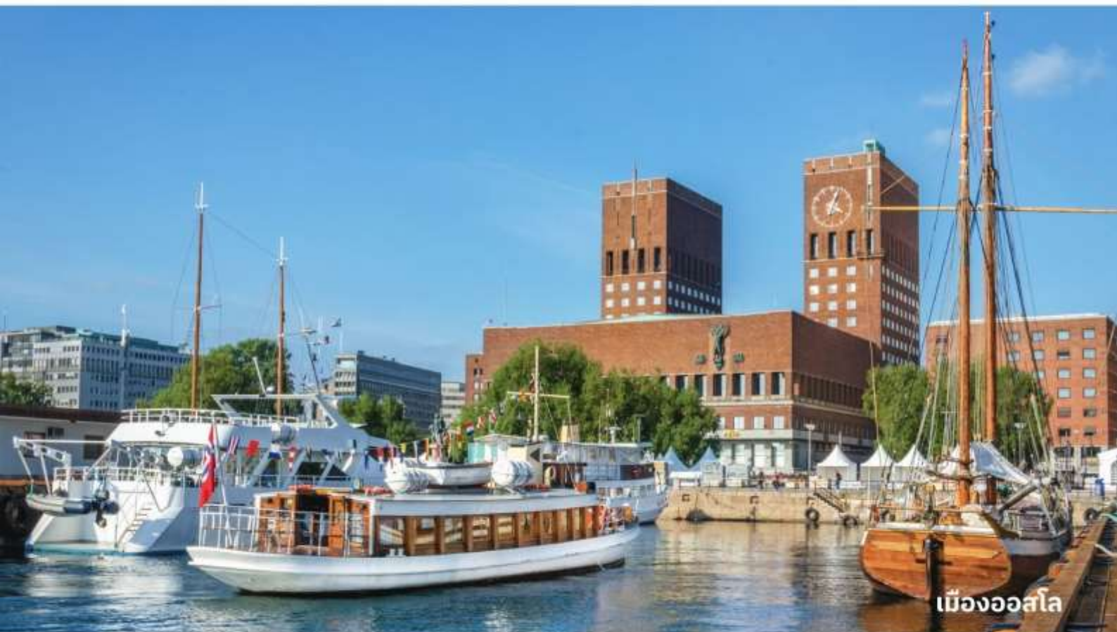
เมืองออสโล

เป็นเมืองที่มีค่าครองชีพสูงที่สุดในโลกแทนที่โตเกียว ออสโลตั้งอยู่ขอบด้านเหนือของอ่าวฟยอร์ด