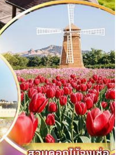
สวนดอกไม้เมืองเซ่อ

ชมสวนดอกไม้เมืองเซ่อ ฟาร์มแกะฮงจิง อู๋สุรณัฐสถานเจียงไคเช็ค ส่องเรือทะเลสาบสุริยันจันทรา วัดพระถังซำจั๋ง ป้อมน้ำพุร้อนเป่ย์ถั่ว วัดหลงชาน แวะถ่ายรูปปดิกไทเป 101 ซีเหมินติง ไถจงโมถ์มาร์เก็ต พิเศษ..เมฆหมอกนึ่งจักรพรรดิ เมฆเสี้ยวหลงเป่า เมฆซาบูบุฟฟ้าดัลสไตน์