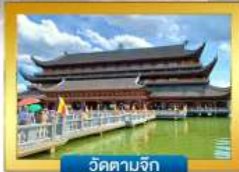
วัดตามจิก