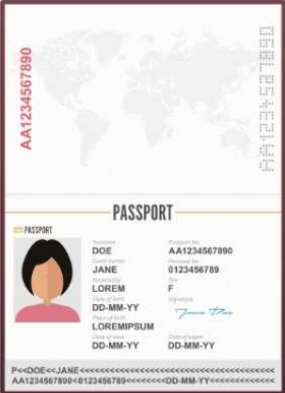
รูปถ่ายหน้าพาสปอร์ต