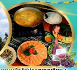
ชาบูหม้อไฟปลาสดเอจียัน + ไวน์แดง