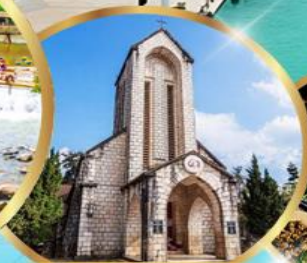
โบสถ์หินซาปา