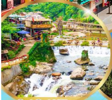
Cat Cat Village