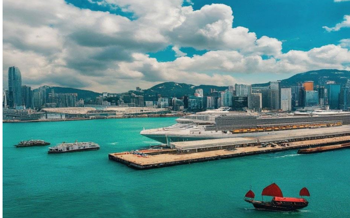
Spectrum Of The Sesa – QQCRHKG-RCI032 – (HONG KONG 5D4N) – (CRUISE ONLY)

วันแรกของการเดินทาง ทุกท่านควรเดินทางมาถึงท่าเรือ Hong Kong - Kai Tak Cruise Terminal, 33 Shing Fung Road, Kowloon, HongKong. เพื่อทำการเช็คอินก่อนอย่างน้อย 3 ชั่วโมงก่อนเรือออก จาก สนามบินนานาชาติ เซ็กลัปก๊อ๊ก เดินทางโดย Taxi มาถึง ท่าเรือใดต่ักใช้เวลาประมาณ 1 ชม